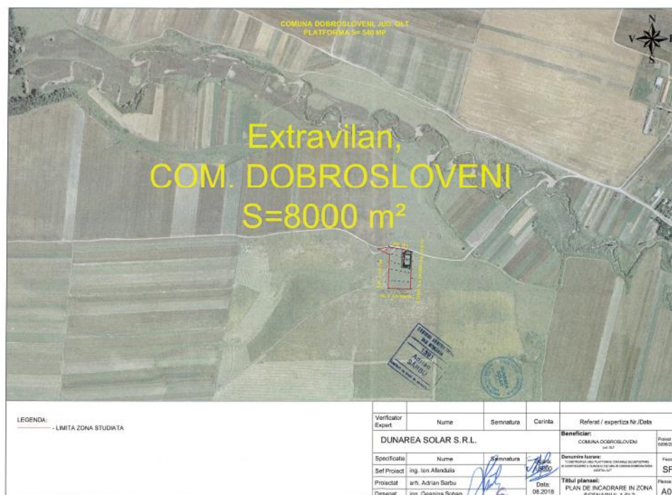
Plan de încadrare în zonă

Planuri de situație, planuri generale, profile longitudinale și transversale, cu situația proiectată, sunt prezentate în continuare: