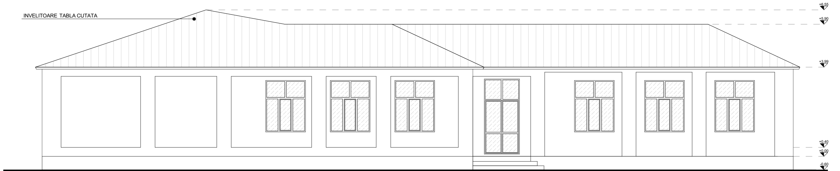
EXISTENT CORP C1 - FATADA SUD