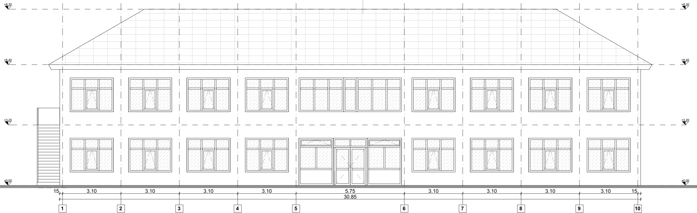
EXISTENT - VEDERE SUD - ACCES

Invelitoare din tabla zincata Sarpanta lemn